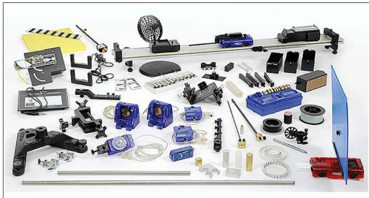
Egy mechanika csomag tartalma

A szenzorcsomagok tantárgyakhoz kapcsolódó csomagokban vásárolhatók meg, amelyek számos további szenzorral bővíthetők tovább az egyéni igények függvényében. Mindegyik tantárgy (fizika, kémia, biológia, földrajz/természetismeret) esetében egy Kezdő csomag (StarterKit) és egy Standard csomag érhető el. A Kezdő csomag az adott tantárgyhoz szükséges legalapvetőbb szenzorokat és eszközöket tartalmazza, míg a Standard csomag a komolyabb igények kiszolgálására szolgál. Az egyes csomagok részletes tartalmának ismertetését a PASCO weboldalán tekinthetjük meg, de elérhető a magyar nyelvű oldal is, amely számos, oktatási kiegészítővel is szolgál.